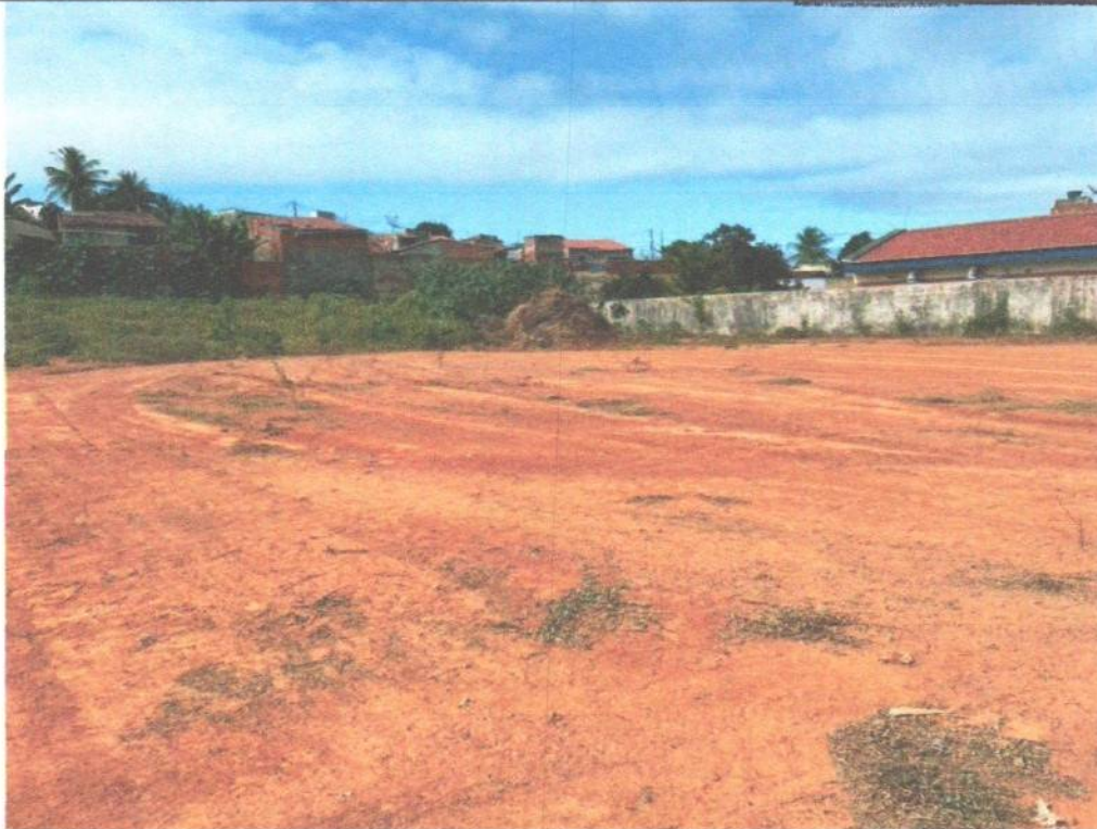
Terreno destinado a construção, localizado na rua Professora Florência Maia, SN, bairro Alto de Santa Tereza, município de São Miguel/RN