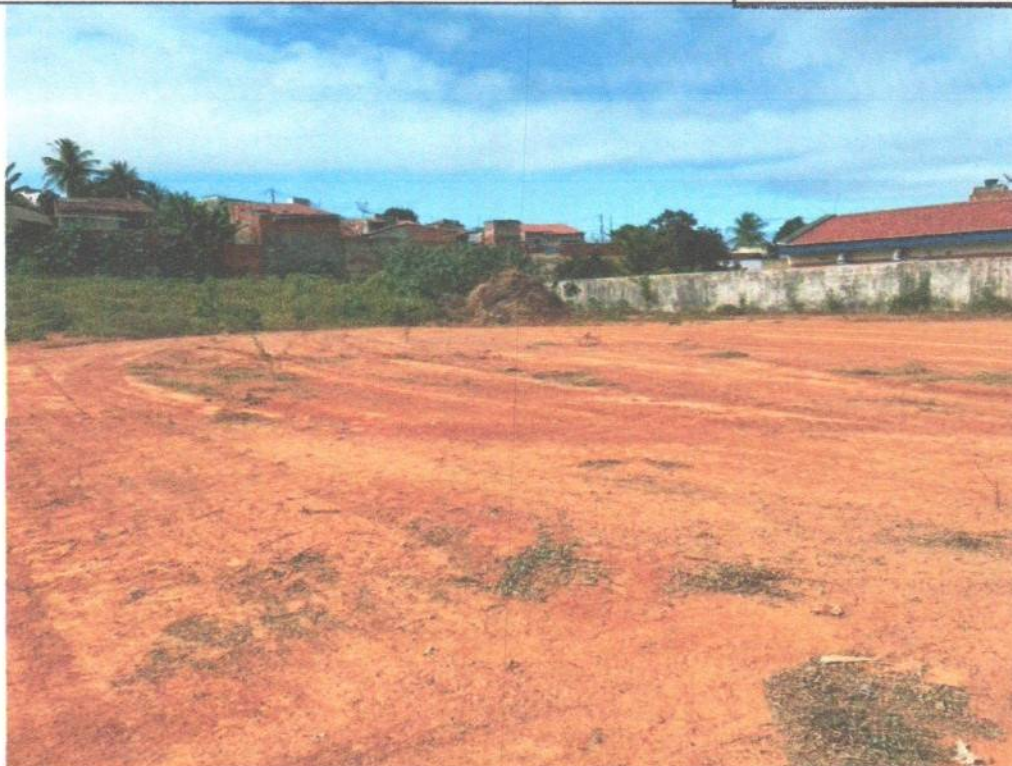
Terreno destinado a construção, localizado na rua Professora Florência Maia, SN, bairro Alto de Santa Tereza, município de São Miguel/RN